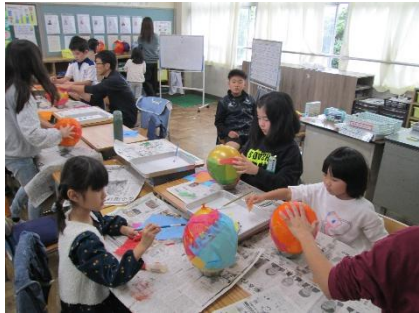
【なかよし学級作品作り】

すっかり涼しくなり、学習もはかどっている毎日です。なかよし学級は、みんなで作品展に向けて作品作りに没頭していました。4年生は、音楽朝会で美しいハーモニーと楽しく仲のよい雰囲気之歌で表現してくれました。市内合唱祭が楽しみです。1・2年生は、こども動物自然公園に校外学習に出かけ、2年生がリーダーとなって1年生に優しく声をかけ、協力して案内してくれました。みんな大きな成長が見られます。