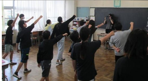
← 青組応援団練習 赤組応援団練習 →