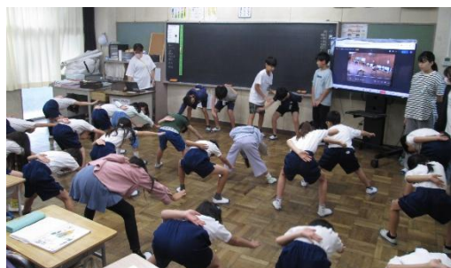
← 伝統の6年生に よる栄ソーラン練習 リレーの練習 → ※全て、業前や休み時間 に練習や準備をしています。