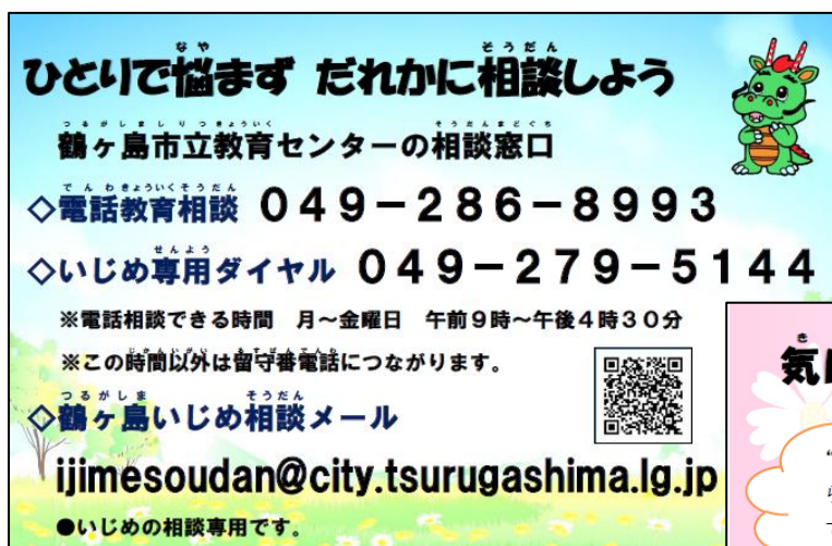
【相談窓口カード（表）】