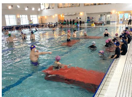
民間委託による水泳学習