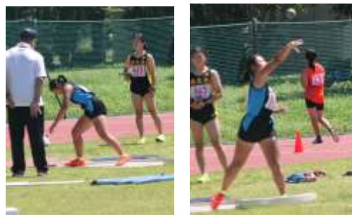
砲丸投です。集中力がすごいです。