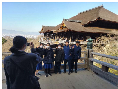
清水寺の舞台を背景に…