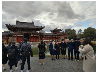
10円玉だ! 平等院鳳凰堂