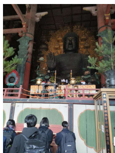
大仏様は大きいね