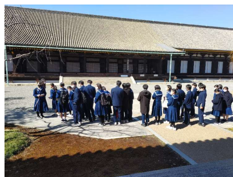
廊下が長かった三十三間堂

2月26日(日)~28日(火)の3日間、2年生が奈良・京都方面に修学旅行に行ってきました。天候にも恵まれ、予定通り順調に進めることができました。1日目は奈良の東大寺・京都の平等院鳳凰堂へ。2日目はタクシーによる班別の京都市内観光(コースは各班ごとに計画を立てました)。3日目は清水寺と三十三間堂へ。この修学旅行のスローガン「『現在、青春は密』古を学び、笑顔あふれる最高の思い出を創ろう。」のもと、実行委員を中心に充実した取組ができました。この旅を通して、協力することの大切さ、仕事への責任感、先を見ての行動、マナーやルールを守ることの大切さなどを学び、クラス・学年の団結力を高めました。この貴重な時間を仲間とともに過ごし、大きく成長したと感じています。いよいよ来月からは3年生になります。今後の進路実現に向けてさらなる成長を期待しています。子供たちの笑顔をたくさん見ることができた旅となりました。