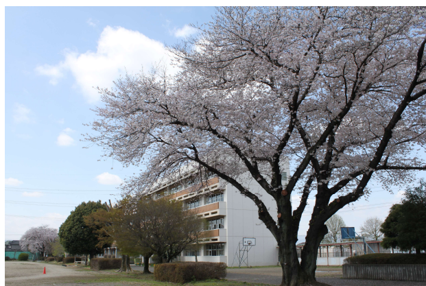
西中の「桜」風景(3/29に撮影しました)

本日、新入生59名を迎え、1年生2学級、2年生2学級、3年生3学級、特別支援学級(きずな)2学級、全校生徒234名で、令和5年度の西中学校の教育活動をスタートしました。昨年度は新型コロナウイルス感染拡大による影響はありましたが、多くの学校行事を工夫してすべて実施することができました。今年度は新型コロナウイルスの対応が大きく変わる中でのスタートです。鶴ヶ島市教育委員会から示されている対策等をしっかり守り、安心安全な学校生活が送れるように工夫して教育活動を進めます。