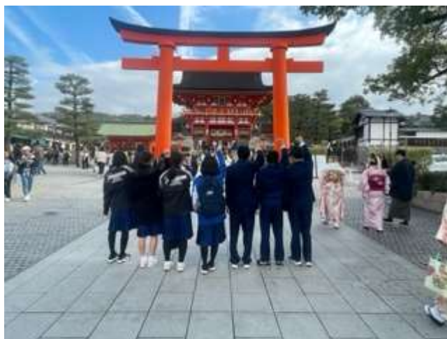
人気の伏見稲荷大社にて

1月18日(木)～20日(土)の3日間、2年生が奈良・京都方面に修学旅行に行ってきました。1日目は奈良の東大寺・京都の平等院鳳凰堂へ。2日目はタクシーによる班別の京都市内観光(コースは各班ごとに計画)。3日目は座禅体験と嵐山へ。この修学旅行のスローガン「温故知新～歴史や文化を学んで最高の思い出を作ろう～」のもと、実行委員を中心に充実した取組ができました。この旅を通して、協力することの大切さ、仕事への責任感、先を見ての行動、マナーやルールを守ることの大切さなどを学び、クラス・学年の団結力を高めました。この貴重な時間を仲間とともに過ごし、大きく成長したと感じています。子供たちの笑顔をたくさん見ることができた旅となりました。