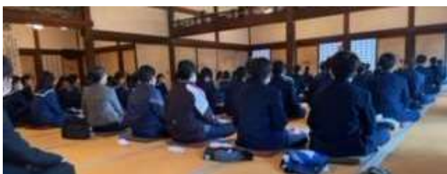
上：平等院鳳凰堂にて 下：妙心寺で座禅体験